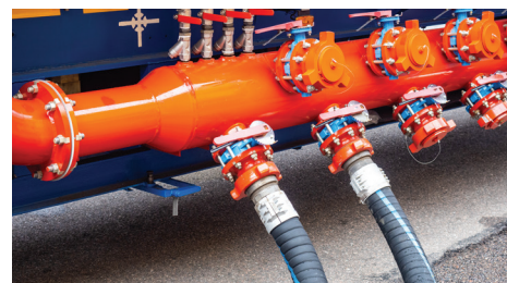
Zapobieganie rozlaniu podczas przelewania płynów