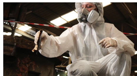
Do szybkiego zastosowania w przypadku nieszczęśliwych pojemników podczas akcji usuwania wycieków