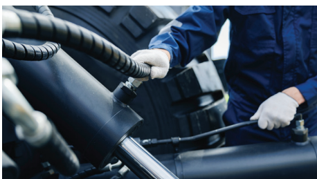
Podczas przechowywania lub konserwacji narzędzi zasilanych gazem lub hydraulicznych