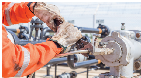
Podczas konserwacji pomp, zaworów, oraz generatorów w terenie