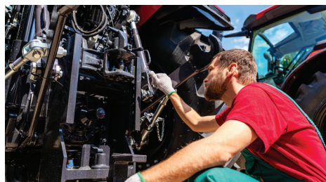
Durante a troca de óleo, a substituição de filtros e a contenção de derrames sob o veículo, incluindo aplicações em camiões de assistência em estrada