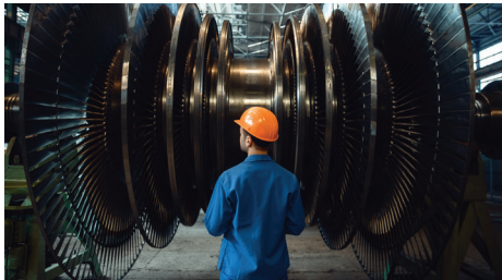
Leckagen aus Maschinen und Fahrzeugen auffangen