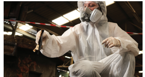
Für den schnellen Einsatz bei undichten Behältern im Rahmen von Sanierungsmaßnahmen nach Verschüttungen