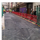
TTEM EuroMat® Tapete de proteção de solo sólido de 12 mm para serviço médio com alças feitas de polietileno de alta densidade 100% reciclado.