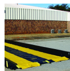
2834 Passadeiras de trilhos Coloque este tecido revestido a vinil de alta visibilidade dentro da berma para proteção contra a abrasão.