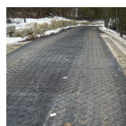
AM AlturnaMATS® Tapete de uso médio com espigões antideslizantes diamantado