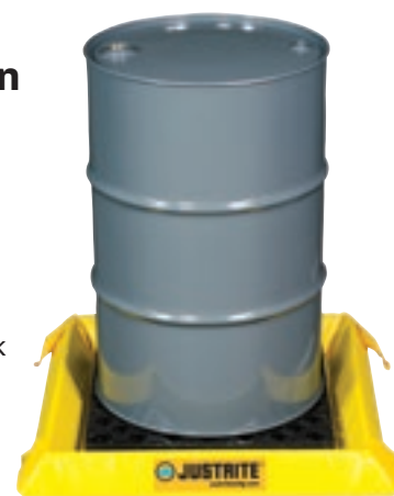
28400 met 16425 optioneel rooster