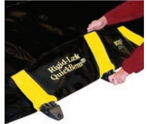
Een eenvoudige ruk vergrendelt steunen in staande positie.