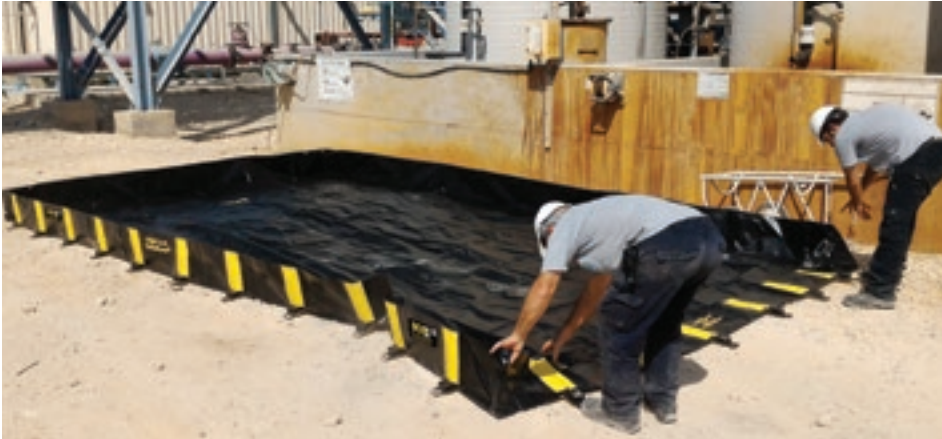
Geen montage nodig - bespaart tijd, klaar in enkele minuten!